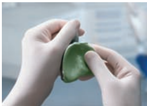
Jak każdą prawdziwą masę „putty”, Express Penta Putty można formować na łyżce palcem

Naukowcy 3M ESPE zaproponowali innowacyjną recepturę nowej masy. Dzięki zastosowaniu odpowiednich, reaktywnych polisiloksanów i wypełniaczy masę dozuje się łatwo pomimo tak gęstej konsystencji. Dodatkowo system Pentamix 2 rozszerzono o czerwone końcówki mieszające Penta, zmodyfikowane nakrywki PentaMatic i wzmocniony metalem pojemnik – elementy, które zaadaptowano do gęstości „putty”.