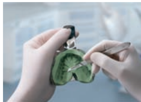
Idealny do techniki dwuczasewej – wycisk wstępny można łatwo przycinać