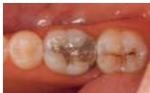
Pęknięte, stare wypełnienie z amalgamatu