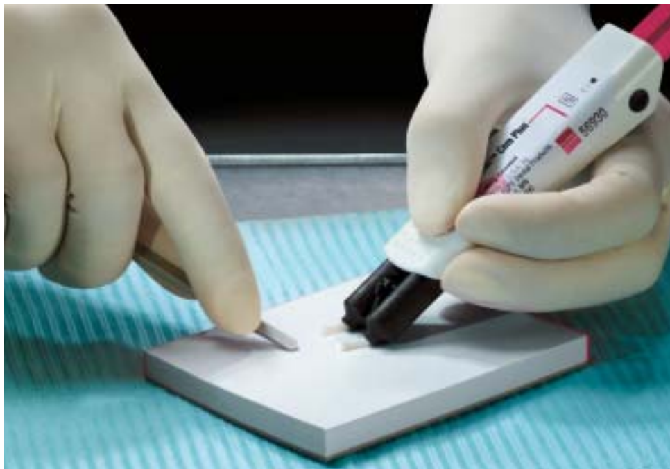
Wygodny podajnik Clicker, umożliwiający precyzyjne dozowanie w proporcjach 1:1

Dzięki podajnikowi Clicker dozowanie materiałów jest precyzyjne i higieniczne. Pasty mieszane są w odpowiednich proporcjach a uzyskany cement posiada optymalne właściwości.