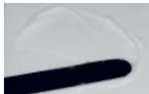
Łatwe dozowanie i mieszanie cementu Ketac Cem Plus