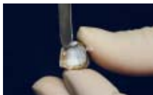
Nakładanie: prosta aplikacja Ketac Cem Plus do korony