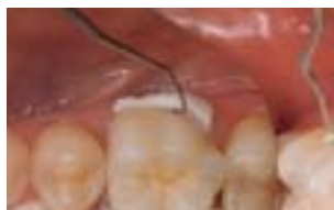
Osadzanie: łatwe usuwanie nadmiarów cementu