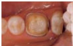
Ząb opracowany pod koronę